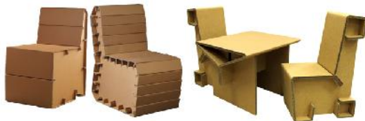
Gambar 4.5. Kursi berbahan kardus karya desain Produk Mitra