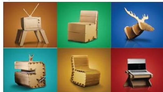
Gambar 1.1 Produk UKM DusDukDuk dari bahan baku kertas kardus

Pengrajin “DusDukDuk” sebagai pengrajin kertas kardus, usaha ini berdiri sejak tahun 2013.