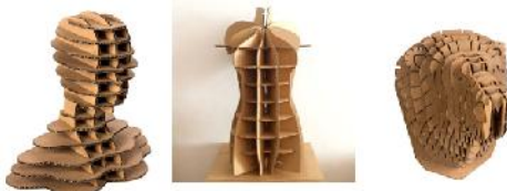
Gambar 4.3. Karya desain Produk Mitra