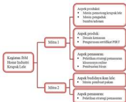
Gambar 1. Pendampingan pada Mitra

Kegiatan pendampingan yang dilakukan pada IbM ini dapat dilihat pada Gambar 1.