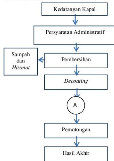
Gambar 1 Alur proses ship recycling (Sumber : Fariya, Siti. 2016)

Empat kondisi Existing Industri Ship recycling di Indonesia. Keberadaan industri pemotongan kapal belum cukup dikenal di Indonesia. Sehingga menyebabkan kurangnya perhatian yang diberikan oleh pemerintah guna perkembangannya. Kegiatan pada proses Ship recycling dapat dilakukan seperti pada gambar berikut [4] :